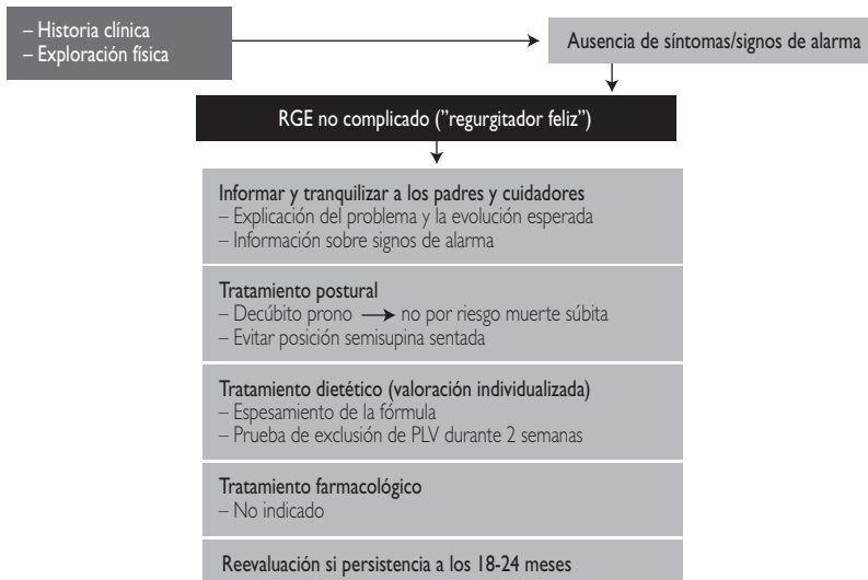
Figura 1. Regurgitación: esquema de actuación 3,14,15

En la alimentación, las opciones a valorar de forma individualizada serían: